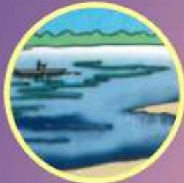
ନଦୀ River नदी