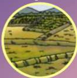
ଜମି Land भूमि