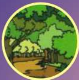
ଜଙ୍ଗଲ Forest जंगल