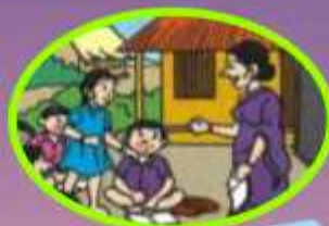
ବ୍ୟକ୍ତି ବିଶେଷ Individual व्यक्ति