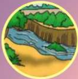
ନାଳ Stream धारा